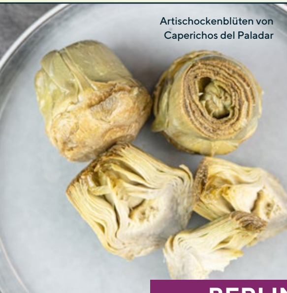
Artichokenblüten von Caprichos del Paladar